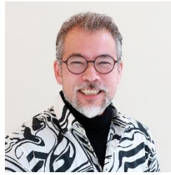
写真家 茅原田 哲郎 氏

「写真を撮られるのが苦手！」という方へ、ちょっとしたコツで自然に美しく撮影されるコツをプロのカメラマンが楽しくお教えします。シワや口元が気になって上手く笑えない、顔をスッキリ見せたい。そんな苦手意識を解決しましょう。 ※個人撮影はございません。