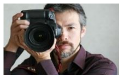
写真家 茅原田 哲郎 氏

自然光のみで撮影する写真家 茅原田哲郎氏の写真は、とてもナチュラルで満足度の高い仕上がりがです。ぜひお気に入りの服装でお越しください。(撮影時間は個別指定)