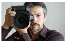
写真家 茅原田 哲郎氏

撮影代 7,000円(税込) ※撮影時間はお一人様 約30分 ※画像データでお渡し