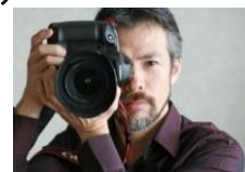
写真家 茅原田 哲郎氏

自然光のみで撮影する写真家 茅原田 哲郎氏の写真は、とてもナチュラルで満足度の高い仕上がりがです。ぜひお気に入りの服装でお越しください。撮影時間はお一人様 約30分 (撮影時間は個別指定)