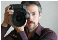
写真家 茅原田(ちまがた) 哲郎氏

自然光のみで撮影する写真家 茅原田哲郎氏の写真は、とてもナチュラルで満足度の高い仕上がります。ぜひお気に入りの服装でお越しください。撮影時間はお一人様 約30分