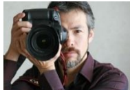
写真家 茅原田(ちむだ) 哲郎氏

自然光のみで撮影する写真家 茅原田哲郎氏の写真は、とてもナチュラルで満足度の高い仕上がります。