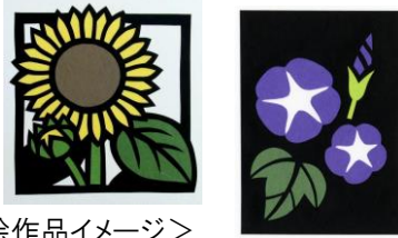
<切り絵作品イメージ>