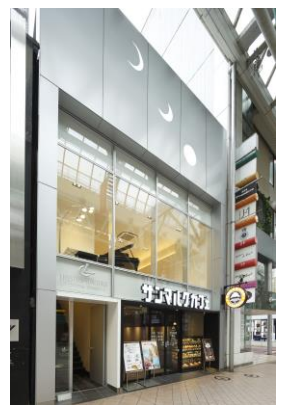
1Fはサンマルクカフェ様